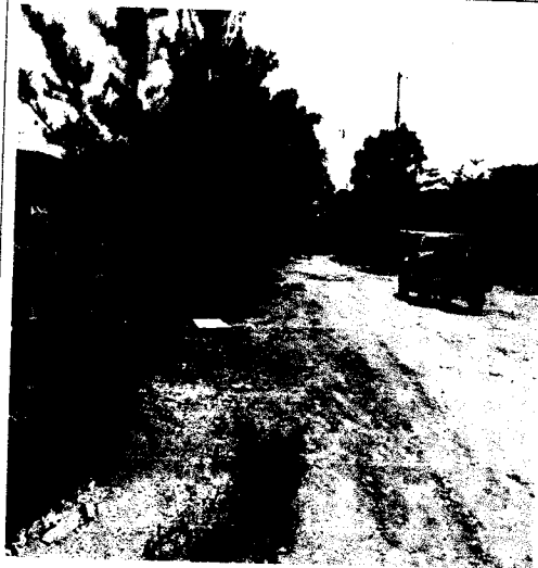
SE PUEDE OBSERVAR TEPADA LA RED PRINCIPAL A SI COMO LAS DESCARGAS AL 100%.