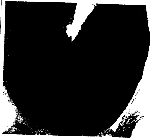
APLANADO DE MUROS INTERIORES DE POZA DE VISITA.