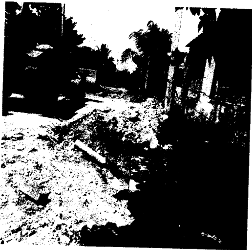
RELLENO DE ZANJA EN LINEA PRINCIPAL Y DESCARGA DOMICILIARIA.