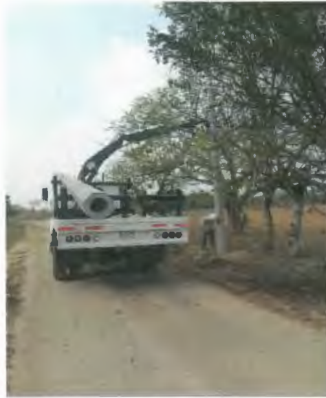
SUMINISTRO E INSTALACION DE POSTE DE CONCRETO DE 12750, INCLUYE RELLENO DE CEPAS CON PIEDRA CALIZA.