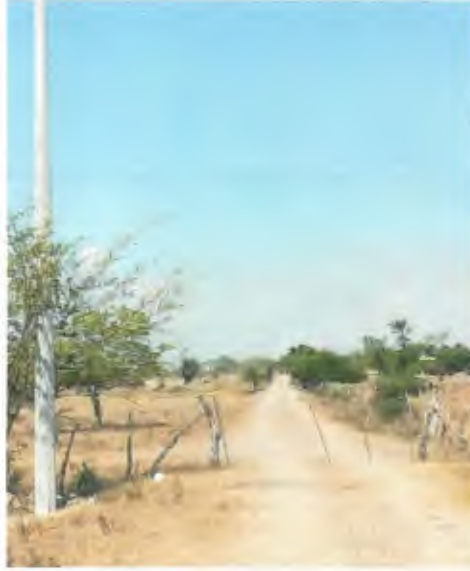
SUMINISTRO E INSTALACION DE POSTE DE CONCRETO DE 12750, INCLUYE RELLENO DE CEPAL CON PIEDRA CALIZA.