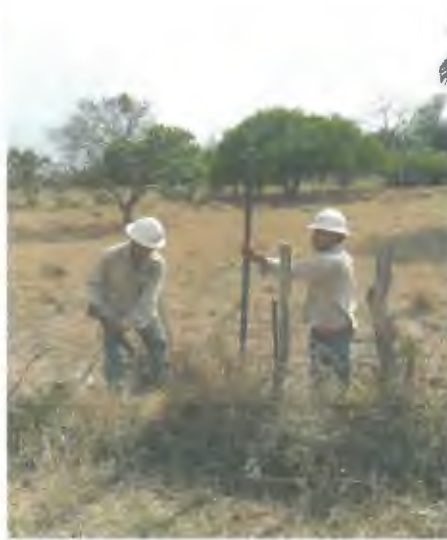
EXCAVACION MANUAL DE CEPA PARA POSTES DE CONCRETO EN TERRENO MIXTO.