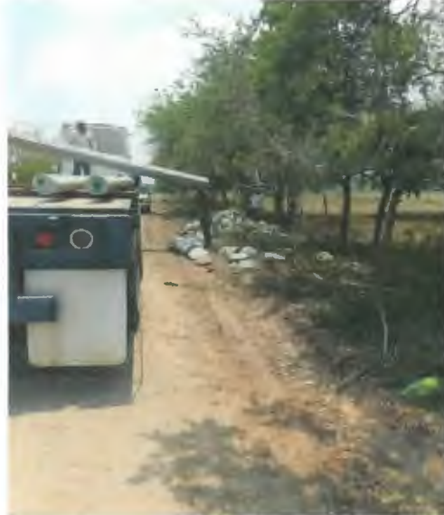
SUMINISTRO E INSTALACION DE POSTE DE CONCRETO DE 12750, INCLUYE RELLENO DE CEPA CON PIEDRA CALIZA.