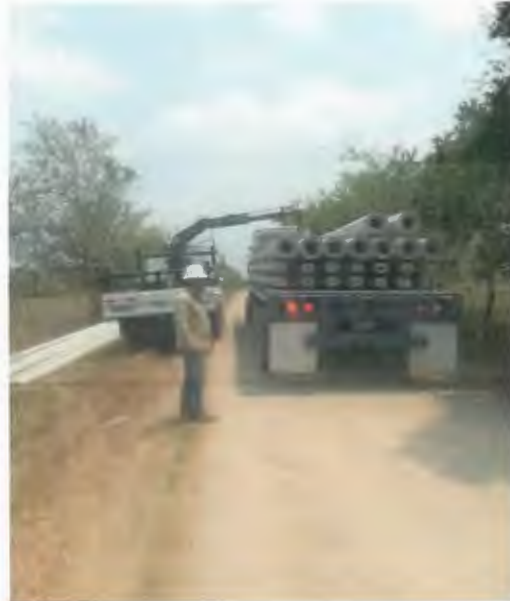
SUMINISTRO E INSTALACION DE POSTE DE CONCRETO DE 12750, INCLUYE RELLENO DE CEPAS CON PIEDRA CALIZA.