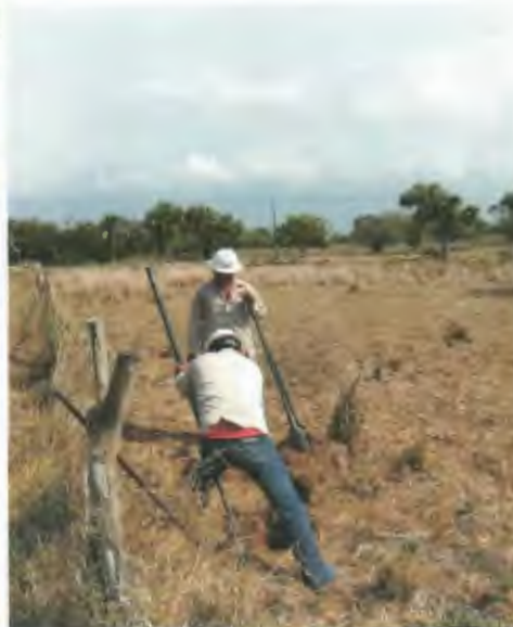
EXCAVACION MANUAL DE CEPA PARA RETENIDA EN TERRENO MIXTO.