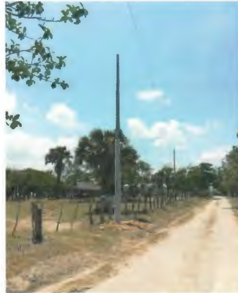
SUMINISTRO E INSTALACION DE POSTE DE CONCRETO DE 12750, INCLUYE RELLENO DE CEPA CON PIEDRA CALIZA.