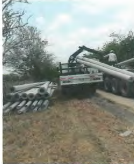
SUMINISTRO E INSTALACION DE POSTE DE CONCRETO DE 12750, INCLUYE RELLENO DE CEPAS CON PIEDRA CALIZA.