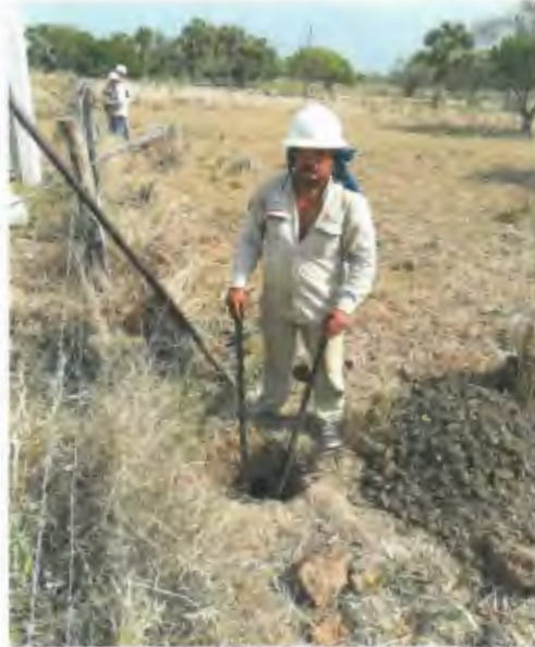
EXCAVACION MANUAL DE CEPA PARA RETENIDA EN TERRENO MIXTO.

AMPLIACIONES Y CONSTRUCCIONES ELECTRICAS ARANO SA DE CV CONTRATISTA