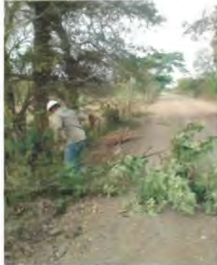
EXCAVACION MANUAL DE CEPA PARA POSTES DE CONCRETO EN TERRENO MIXTO.