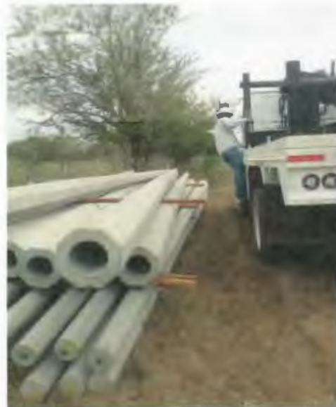
SUMINISTRO E INSTALACION DE POSTE DE CONCRETO DE 12750, INCLUYE RELLENO DE CEPA CON PIEDRA CALIZA