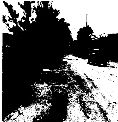
SE PUEDE OBSERVAR TEPADA LA RED PRINCIPAL A SI COMO LAS DESCARGAS AL 100%.