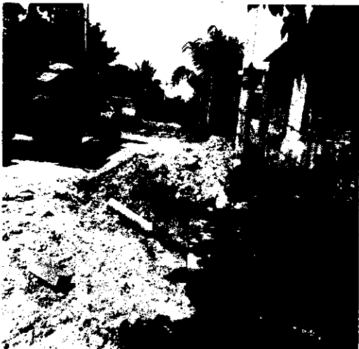
RELLENO DE ZANJA EN LINEA PRINCIPAL Y DESCARGA DOMICILIARIA.