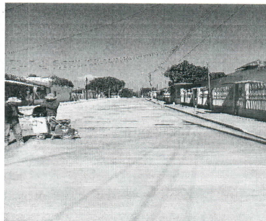
SUMINISTRO Y TENDIDO DE CONCRETO HIDRAULICO