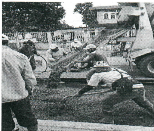
SUMINISTRO Y TENDIDO DE CONCRETO HIDRAULICO