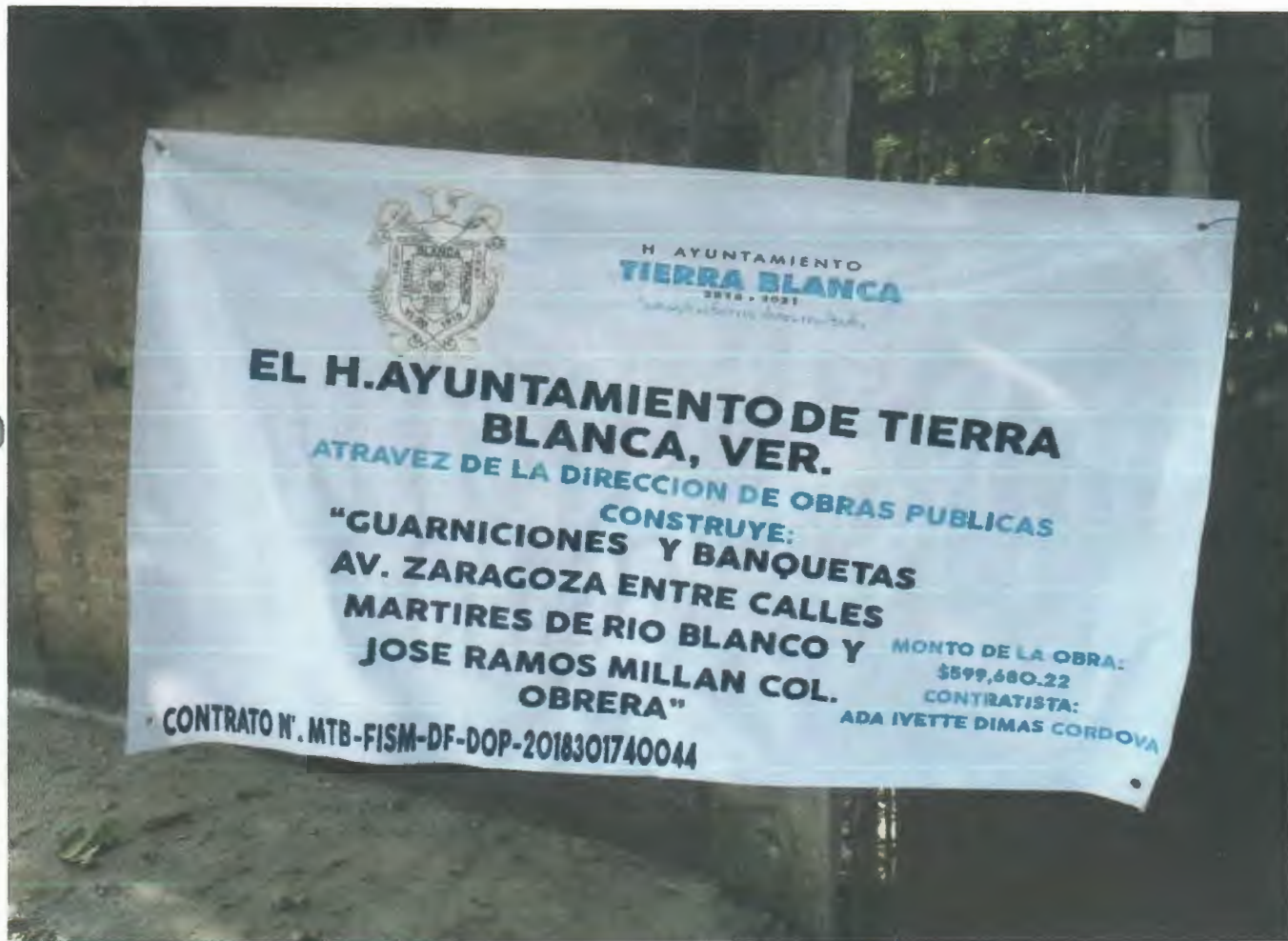
LETRERO DE OBRA ORIZONTAL 0.87 X 1.45 M

DOMICILIO: AV. POPOCATEPTL No. 849 COL. INFONAVIT LOS VOLCANES , VERACRUZ