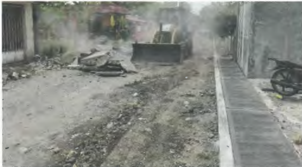
BANQUETA DE CONCRETO HECHO EN OBRA DE F'c=150 KG/CM2., AGREGADO DE 8 CMS., DE ESPESOR