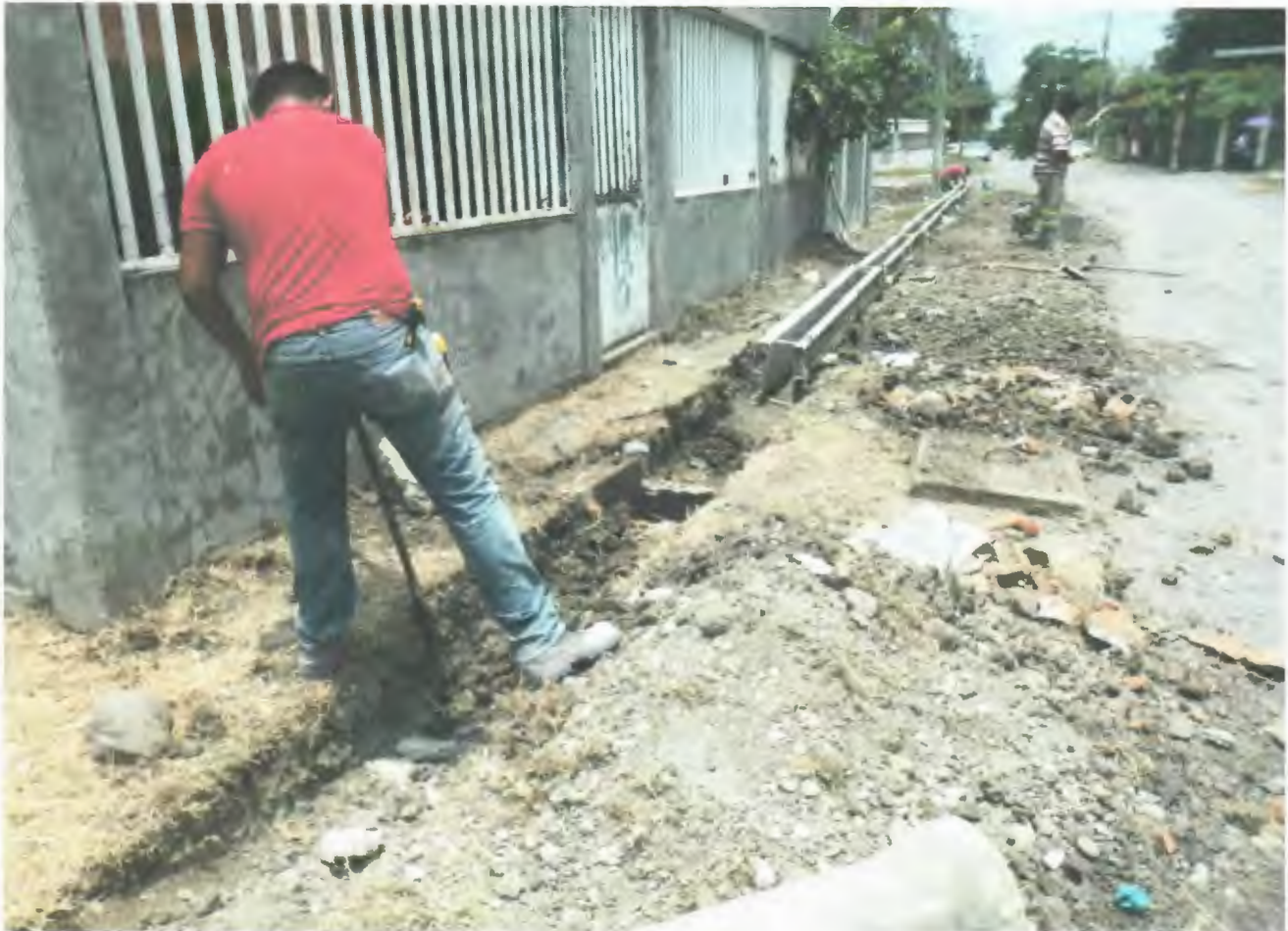
EXCAVACION EN MATERIAL TIPO II SECO, INCLUYE ASESQUE, EXTRACCION DE MAICE, LIMPIEZA

NO. DE CONTRATO : MTB-FISM-DF-DOP-2018301740044