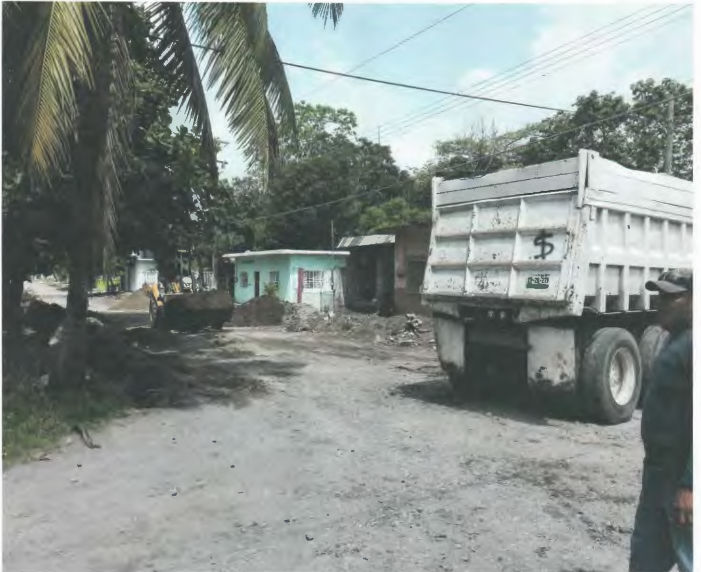
CARGA Y ACARREO AL 1ER., KILOMETRO DEL MATERIAL PRODUCTO DE LA CONSTRUCCION DE LA AV. ZARAGOZA, CAMION DE VOLTEO DE 7m3

NO. DE CONTRATO : MTB-FISM-DF-DOP-2018301740044