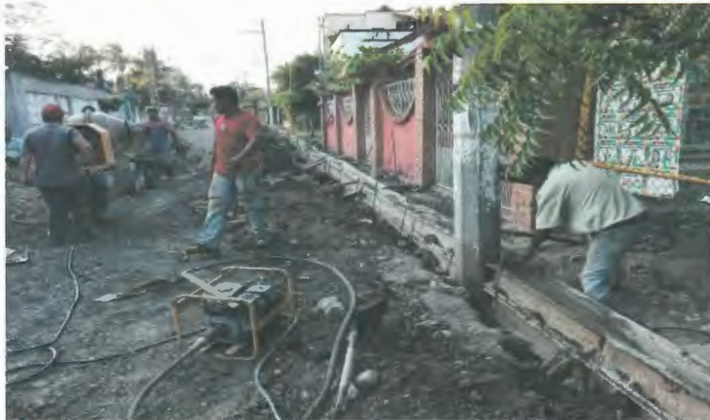
ELABORACION DE GUARNICION TRAPEZOIDAL DE CONCRETO HECHO A MANO 60x30x15 CM2.