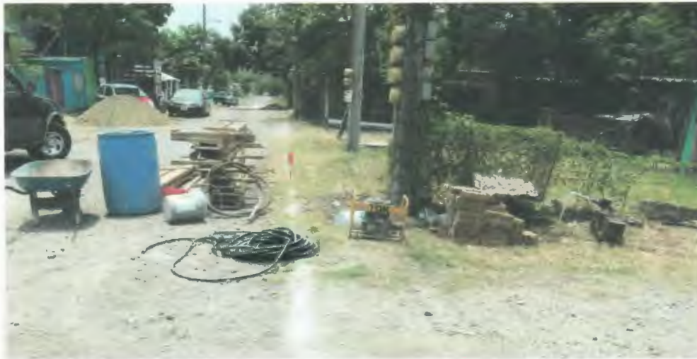
LEVANTAMIENTO. TRAZO, NIVELACION TOPOGRAFICA DEL TERRENO